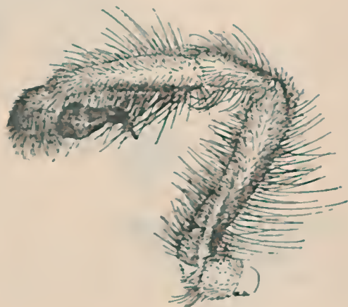
Fig. 8 Butantania hirsuta , g. n., sp. n. Palpo do ♂

Cephalothorace, cheliceras, palpos e patas de tom fulvo; esterno, ancas e peça labial fulvo-claros; abdome pardo com os longos pelos mais claros.